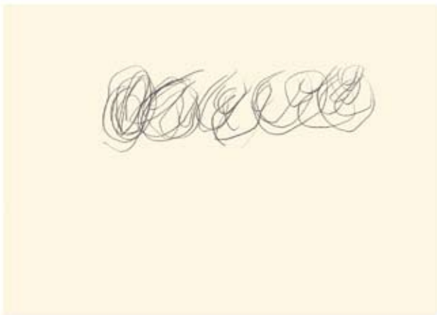
Astillas de un suceso remoto (3) Lápiz sobre papel | 15 x 21 cm | 2006