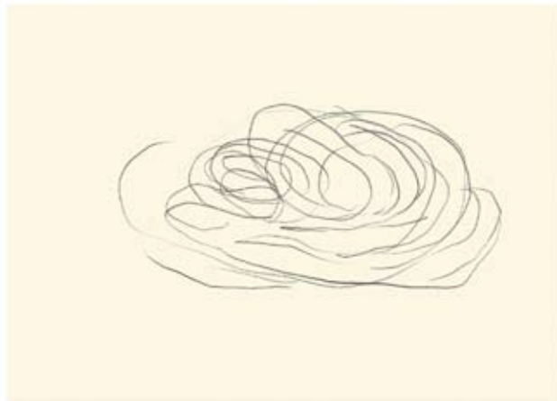
Astillas de un suceso remoto (5) Lápiz sobre papel | 15 x 21 cm | 2006

identidad. Mi mamá, que tuvo esa enfermedad, recordaba pintarse la boca, pero a veces también era capaz de morder el tubo de labios. Cada vez que veía a un niño se emocionaba. Jamás olvidó que tuvo hijos.