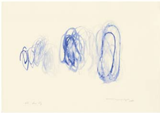
Eco, otra vez Gouache sobre papel | 16.5 x 27 cm | 2007