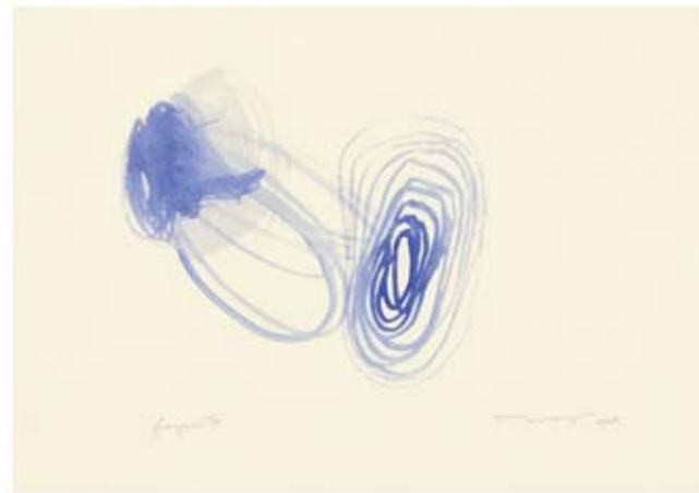
Fragmentos Gouache sobre papel | 16.5 x 27 cm | 2007

Con las flores vino un descubrimiento; gracias a un libro de fotos que me regaló mi mamá de Irving Penn: ahí estaba puesto el drama de la vida y la muerte, de la belleza en su esplendor y su decadencia. Ya había leído a autores japoneses y sabía que para ellos el Ikebana es una representación del cosmos. Es el cielo, la tierra, el hombre junto con los ciclos vitales lo que constituye el arreglo floral, pero no fue sino hasta la experiencia de mi viudez que descubrí que el paisaje nos habla desde un lugar sentimental.