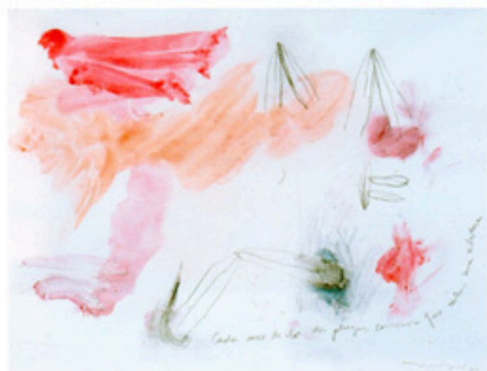
Por el fuego, de la serie Serpiente Because of the fire , from the series Serpent , 1997 tinta y lápiz sobre papel albanero | ink and pencil on albanero paper | 22.5 x 29.5 cm Colección de la artista | Artist's collection