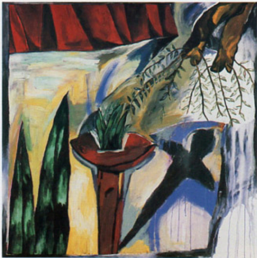
Sombra, 1989 Acrilico/tela Cat. no. 5