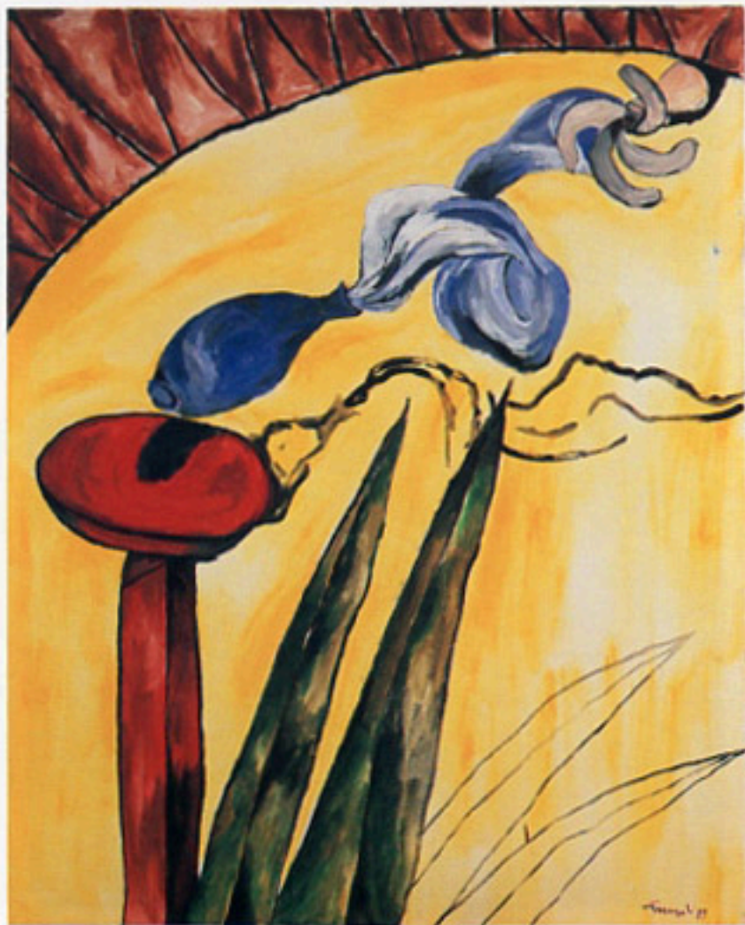
Interior con ventilador, 1989 Acrílico/tela Cat. no 4