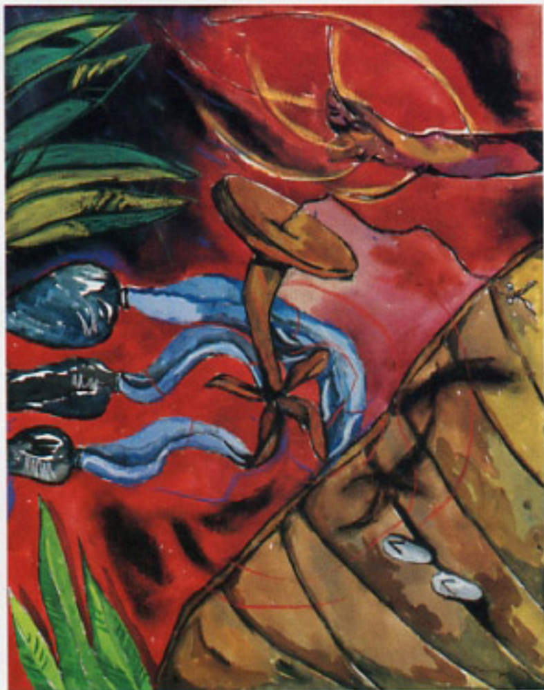
Tres jarrones, 1989 Gouache y pastel/papel Cat. no. 8