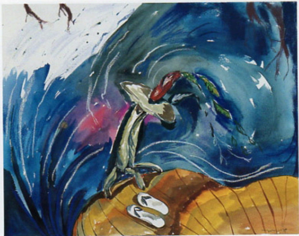
Centro de mesa, 1989 Gouache y pastel/papel Cat. no. 10