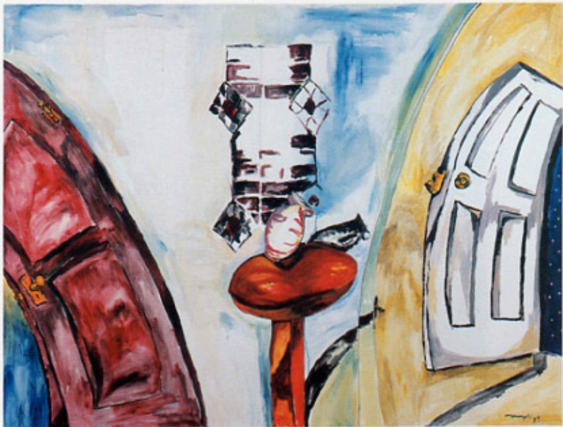
Las dos puertas, 1989 Acrílico/tela Cat. no. 3