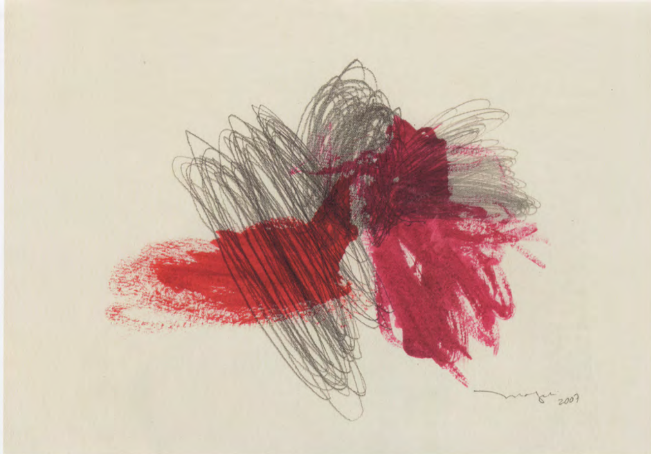
ROJO 2, 2007, SERIE "COMO SI", GOUACHE Y LÁPIZ SOBRE PAPEL, 18.5 X 26.5 CM