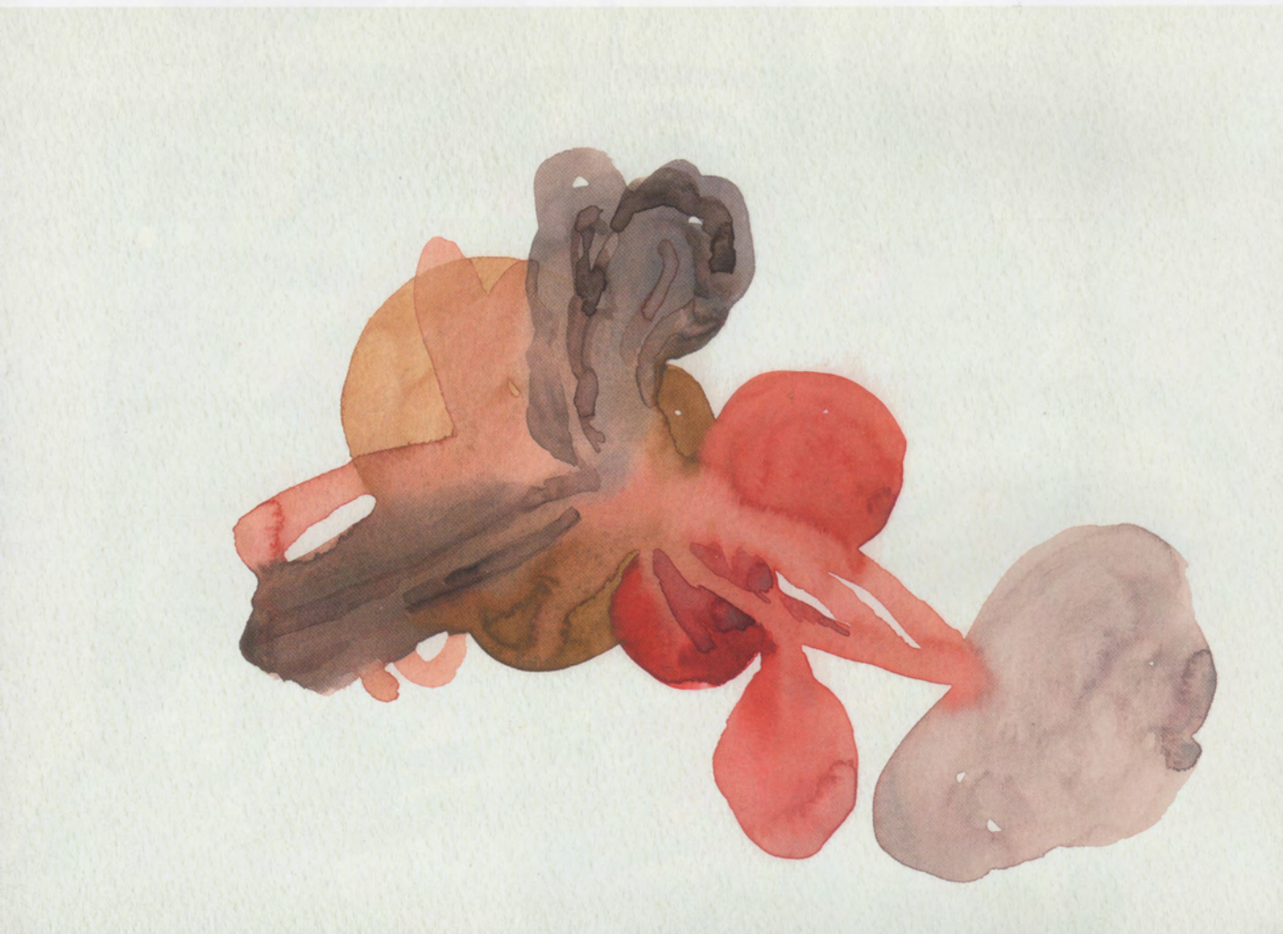
RECONSTRUCCIÓN 5, 2012, SERIE "MELANCOLÍA", ACUARELA SOBRE PAPEL, 20.8 X 29.5 CM, COLECCIÓN PARTICULAR