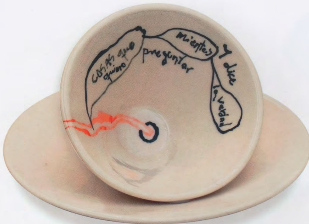
MIENTO, 2002, SERIE "ALLÁ", CERÁMICA, 14.5 X 26 CM, DE DIÁMETRO

sucede a su alrededor y en los demás. Su apertura me permitió involucrarme rápidamente en el ámbito de sus ideas, de su rico mundo intelectual, captando la emotividad y pasión que siente por su trabajo, y disfrutar de su perfil sensible y cálido.