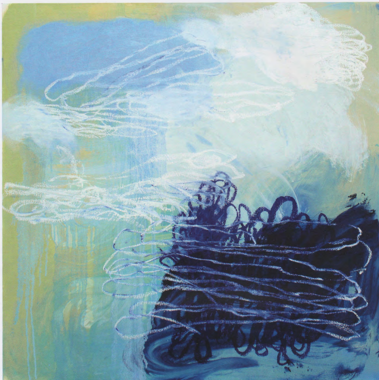
NO OLVIDO, 2008 , OLEO SOBRE TELA, 80 X 80 CM, COLECCIÓN PARTICULAR