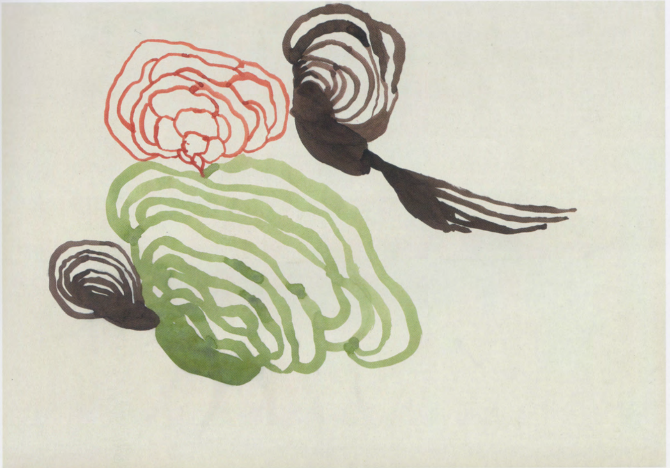
EL FIN DEL MUNDO 10, 2012, SERIE "MELANCOLÍA", ACUARELA SOBRE PAPEL, 21 X 27.5 CM