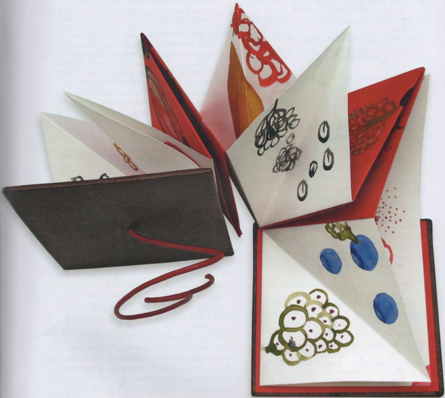
NOMBRAR "C", LIBRO DE ARTISTA, ACUARELA SOBRE PAPEL, 12 X 12 X 2 CM