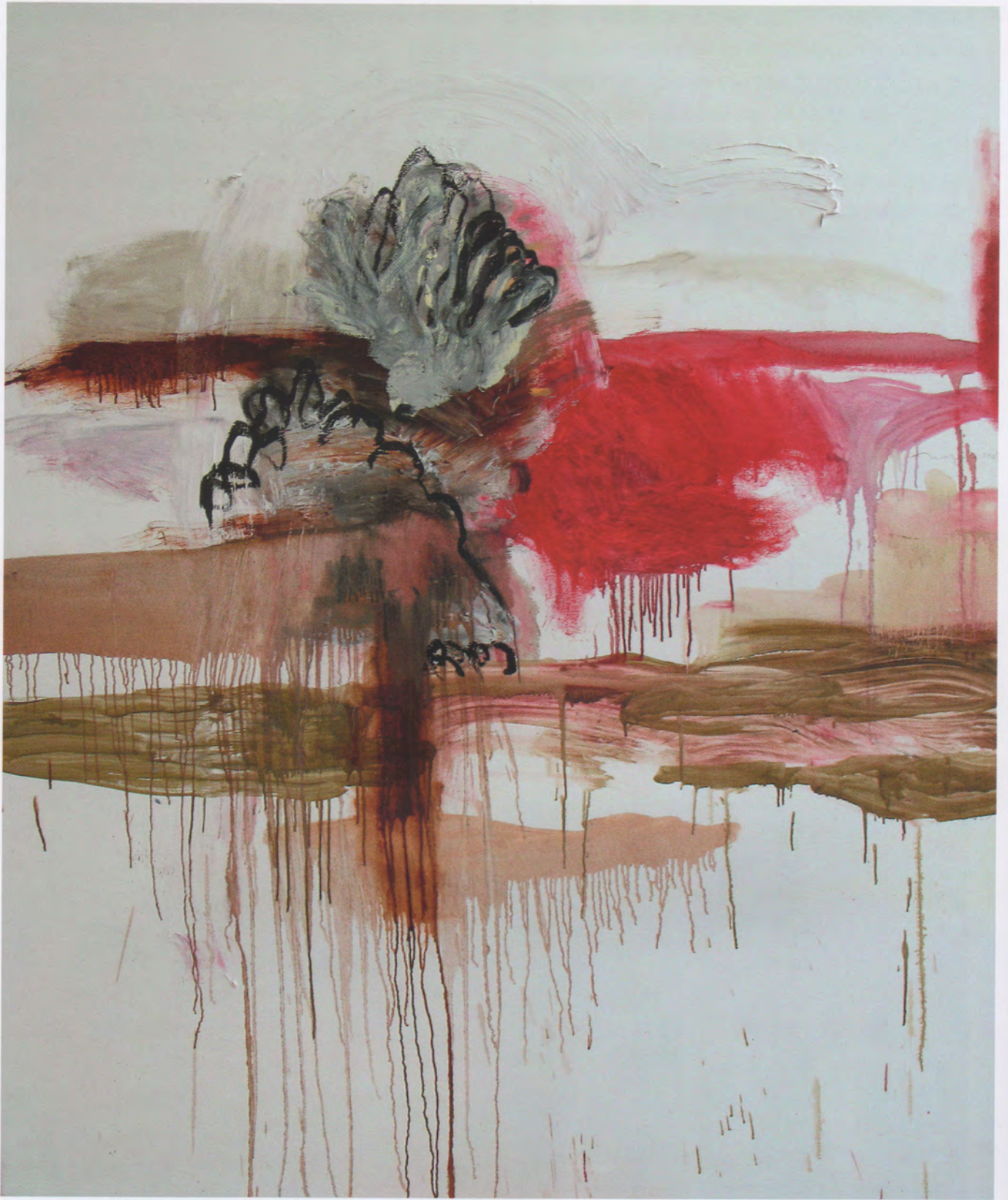
ECO, 2009, SERIE "AKASO", OLEO SOBRE TELA, 175 X 145 CM, COLECCIÓN PARTICULAR