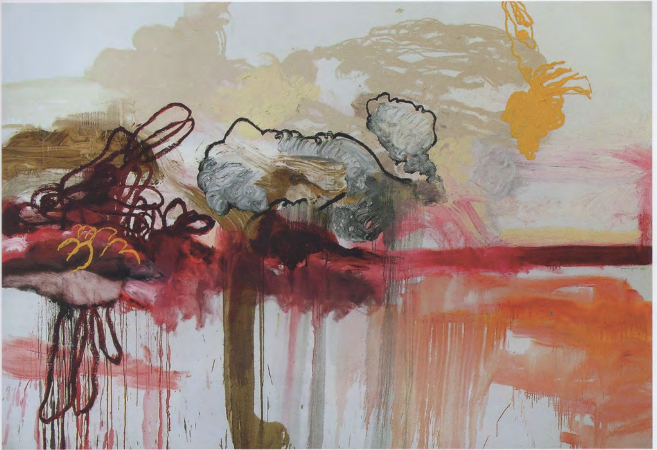
DESPUÉS DE LA LLUVIA, 2009, SERIE "AKASO", OLEO SOBRE LINO, 244 X 366 X 13 CM, COLECCIÓN SERGIO AUTREY

ontológicos que ha caminado de la mano con sus reflexiones sobre la vida cotidiana. Estos dos caminos existenciales van a dar sentido a la más exquisita proyección visual. Su obra toma referencia de los objetos, analiza su forma y sus significados para convertirlos en signos libres que le sugieren nuevas formas al roce sutil de su pincel. Ella nos invita a mirar y a gozar otorgando un receso a la razón.