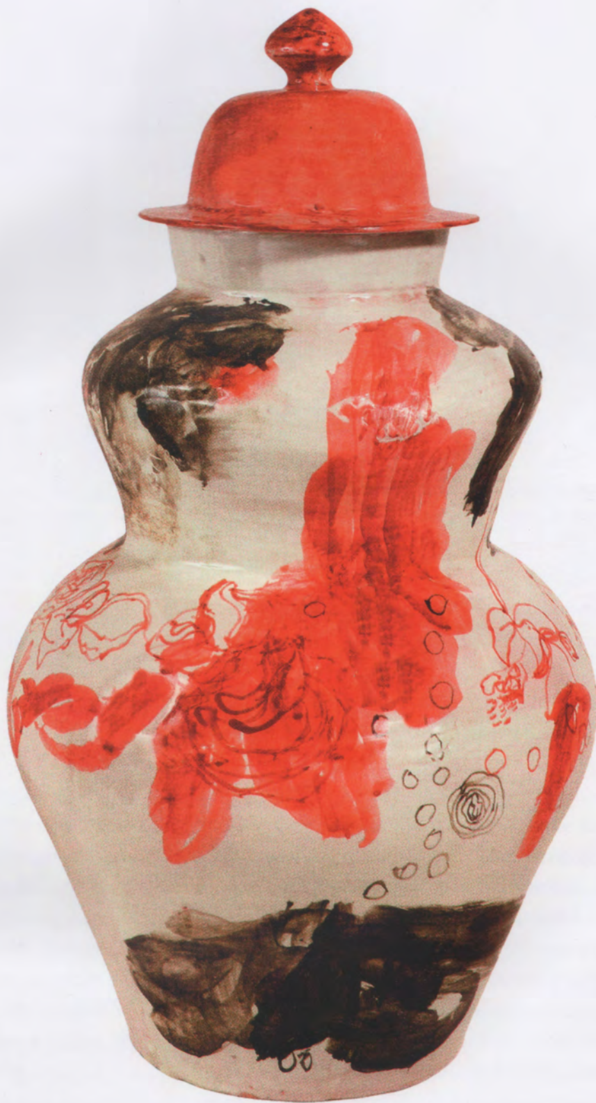
SIN TÍTULO, 2005, TIBOR DE TALAVERA, 74 X 31 CM DE DIÁMETRO